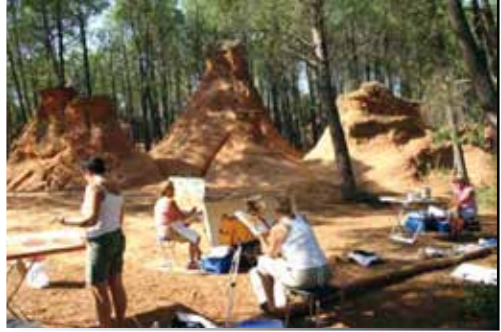
© Richter Art, Malen in der Provence

Nähere Einzelheiten/Anmeldung (Kursgebühr etc.) über die Homepage von Fr. Richter oder per Email: gisela@richter-art.de